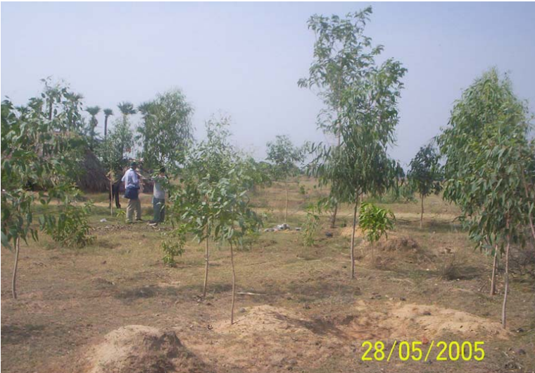
Grove with multiple species – Bethel Nagar பல இனவகை தோப்பு – பெத்தெல் நகர்

All the Small Groups who have single kind of tree should immediately start planting some additional trees other than casuarina and eucalyptus. We have informed through our Chezumai to be ready with seedlings, so that immediately after the rainy season transplanting can be done. Now we had good rain. Immediately start transplanting your seedlings, if you do not have any seedlings, start a nursery with multiple species of seedlings in polythene bags immediately. Your quantifier will be visiting your groves during January-February 2006 for quantification. During the quantification, if you do not have any multiple species, the quantifier will not quantify your single kind trees.