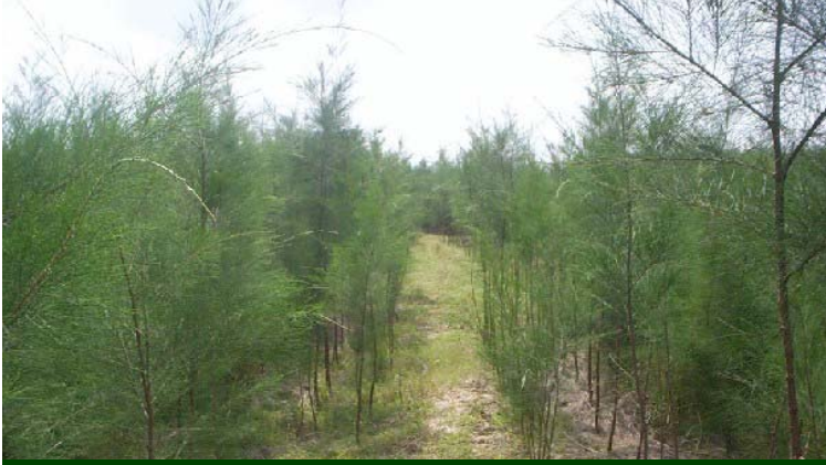
Single kind of species Casuarina trees of Vasudevan Small Group

ஒரு இன வளர்ச்சி சவுக்கு மரங்கள் - வாசுதேவன் சிறு குழு