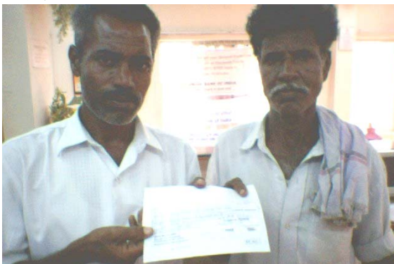
Perumal Small Group / பெருமாள் சிறு குழு

TIST is not here to encourage one single kind of trees like casuarina or eucalyptus. TIST is encouraging the Small Groups to do reforestation/afforestation. A forest means lot of trees and different types of trees, not just single kind of trees. Now you may wonder that in a forest trees and plants are very tightly grown, but why TIST does not allow you to plant trees with less spacing. The reason for having good spacing between each tree is to allow the tree to grow to good height. For example, if a mango tree is planted with good spacing, the mango tree grows at least 10 m in height with 4-5 m long side branches. This full-grown mango tree may sequester the carbon produced by one lorry per day. Suppose the spacing for the mango trees are very minimum, then the tree will grow not 10 m height and the side branches will not reach 4-5 m, automatically the carbon sequester by this tree will fall down. TIST is facilitating to have continuous funding for the Small Group Voucher payment through revenue from the carbon credits market. If the trees grown by you do not attain its normal height then how do we sequester the carbon and how do we market the carbon credits. Grow multiple species of trees and give enough spacing between each tree and enjoy the benefits from TIST.