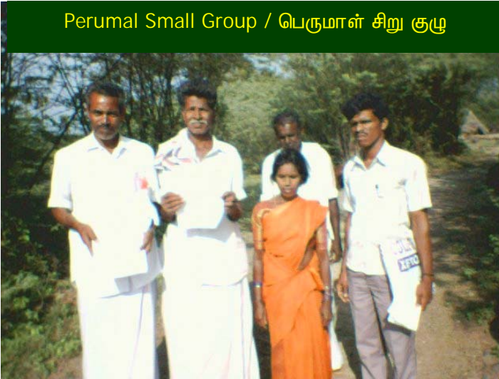
Perumal Small Group / பெருமாள் சிறு குழு

Due to the trimming of the side branches the trees have gained good vertical growth. This Small Group got their first voucher payment only during November 2005, i.e., after more than two years. The main reasons for such a delay are: a) They never attended the node meetings regularly and SGMR submission was very poor, b) They did not have non-relative members in their group, c) They were practicing monoculture, having just casuarinas trees instead of having multiple species. Though the members of this Small Group lost interest with TIST for the delay in voucher payment, but still TIST did not go away from them. TIST continuously followed them and made them perform the basic requirements of TIST and also TIST gave an adhoc amount of Rs.27,000/- as an advance during one of their members marriage. Last month this Small Group received Rs.1,83,733/- from TIST as their first voucher payment. This huge amount is the total voucher for their two years efforts. Immediately after receiving their voucher payment, they returned Rs.27,000/- to TIST which they received as an advance. This Small Group has also signed the GHG contract with TIST.