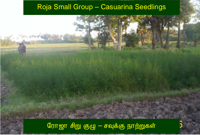
Roja Small Group – Casuarina Seedlings

செயல்களையும், கருத்துக்களையும் ஆராய்ந்து நாம் எவ்வகையில் காரணமாகிறோம் என்று சிந்திக்கலாம். இவற்றை செய்வது கடினம். ஆனால் ஆராய்ந்து பின் நாமும் இதற்கு ஒரு காரணம் என்று அறிந்தவுடன், நம்மால் புன்படுத்தப்பட்டவரிடம் நாமே நம்முடைய செயலுக்காக மன்னிப்பு கோருவது அர்த்தமுள்ள செயலாகும்.