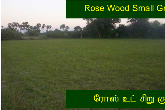
Rose Wood Small Group – Casuarina Trees

இக்குழுவினரிடம் 3200 சவுக்கு மரங்கள் உள்ளன. இவர்களின் தோப்பின் நிலை ரோஜா சிறு குழுவினரின் தோப்பின் நிலைபோலவே உள்ளது. இவர்கள் சிறப்பு பயிற்சிகளை மேற்கொண்டு நர்சரி மற்றும் மரங்களின் தரத்தை உயர்த்த வேண்டும்.