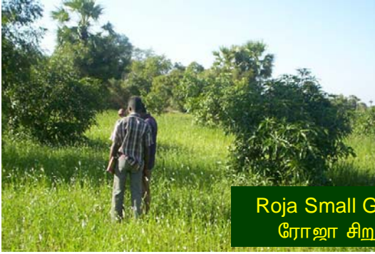
Roja Small Group – Mango Trees ரோஜா சிறு குழு – மாமரங்கள்

இக்குழுவினரிடம் 10,000க்கும் மேற்பட்ட சவுக்கு நாற்றுகள் உள்ளன. இந்த நாற்றுகள் மண்படுக்கையில் வைத்து பராமரிக்கப்பட்டு வளர்த்து வருவதால் இன்றும் ஓரிரண்டு மாதங்களில் மரங்களின் எண்ணிக்கை அதிகரிக்கும். டி.ஐ.எஸ்.டியை பொறுத்தவரை மூன்று வித இணை மரங்கள் 30:30:40 விகிதத்தில் இருந்தாலே வவுச்சர் பேமென்ட் பெற இயலும். நர்சரி தொடங்கும் எண்ணம் இருப்பின் இந்த விகிதத்தை மனதில் கொள்ள வேண்டும்.